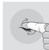
Рисунок 2: Очищення повік і вій.

Обережно помасажуйте невеликими круговими рухами, видаляючи кірки або виділення.