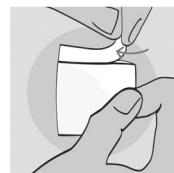
Рисунок 1: Відкрийте саше.

Розірвіть саше, щоб відкрити (Рисунок 1), і розгорніть серветку всередині. Не використовуйте при цьому жодних інструментів.